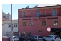
[C] DAR À LÍNGUA Rua da Madalena, 29