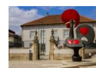
[F] MUSEU DE OLARIA Rua Cónego Joaquim Gaiolas