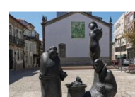
[E] EL PELUJÁNCANU Largo Dr. Martins Lima