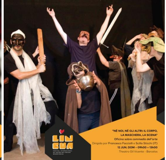
"NÉ NOI, NÉ GLI ALTRI: IL CORPO, LA MASCHERA, LA SCENA" Oficina sobre commedia dell'arte Dirigida por Francesco Facioli e Sello Stocchi (IT) 12 JUN. DOM - 09h00 - 13h00 Theatro Gil Vicente - Barcelos