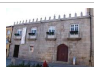
[D] BIBLIOTECA Largo José Novais