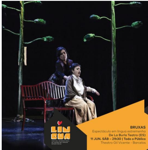
BRUXAS Espectáculo em língua estremenha De La Burla Teatro (ES) 11 JUN. SÁB - 21h30 | Todo o Público Theatro Gil Vicente - Barcelos