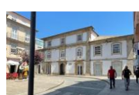
[B] CANTINA DO FESTIVAL Rua Dom Diogo Pinheiro, 2-4