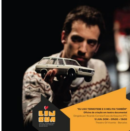
"EU USO TERMOTEBE E O MEU PAI TAMBÉM" Oficina de criação em teatro documental Dirigida por Ricardo Correia/Casa da Esquina (PT) 12 JUN. DOM - 09h00 - 13h00 Theatro Gil Vicente - Barcelos