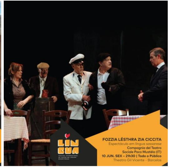
FOZZIA LÉSTHRA ZIA CICCITA Espectáculo em língua sassarese Compagnia del Teatro Sociale Poca Mustela (IT) 10 JUN. SEX - 21h30 | Todo o Público Theatro Gil Vicente - Barcelos