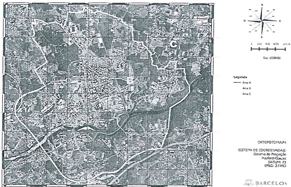
Figura 1: Áreas de instalação de equipamentos de deposição de RU por tipo.