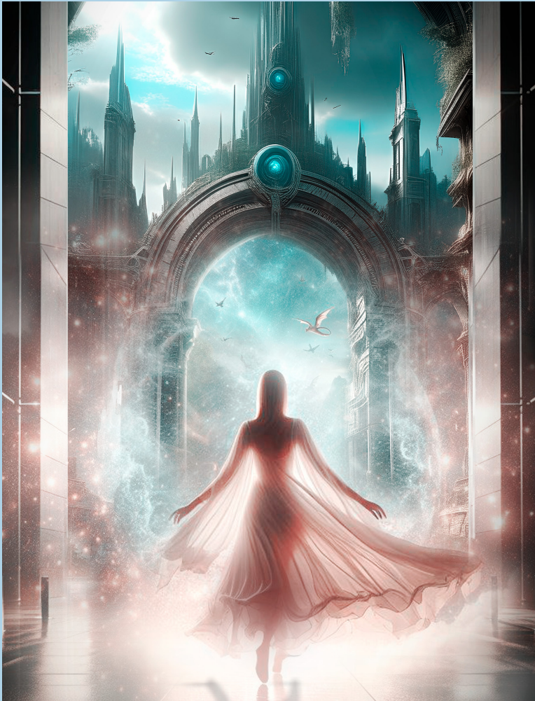
Unreal 2.0 Show (Dance) by Flash Li Dance School

5,00€ • Cartão Quadrilátero, Pessoas com deficiência e acompanhante